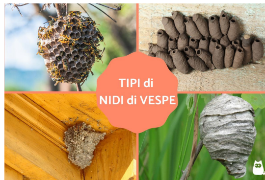
Realizzazione e grafica f. donato

Molti insetti assomigliano ad un ape o ad una vespa, ma non sono affatto velenosi, cercare quindi di mantenere la calma nel caso uno di questi insetti entrasse in casa o fosse presente in casa. Se un insetto riconoscibile come un ape, vespa e simile entra in un veicolo in moto, mantenere la calma, accostare il veicolo ai margini della strada dopo le opportune segnalazioni, cercare di far uscire l'insetto dai finestrini. Nel caso in cui l'insetto cercasse invano di uscire dal parabrezza anteriore o dal vetro posteriore, coprire dall'esterno gli stessi con un panno e contemporaneamente aprire i finestrini laterali. Gli insetti cercano di fuggire sempre in direzione della luce.