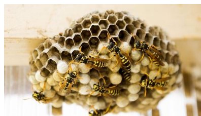
nido di vespe

In presenza di api bisogna attivare sempre gli Apicoltori locali per la cattura degli sciami.